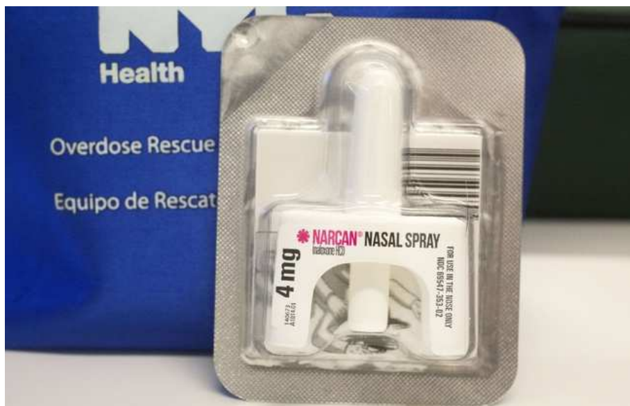
Le spray nasal Narcan a la même action que nalscue: il permet de sauver des personnes qui font une overdose.

Et le spécialiste émet une hypothèse qui pourrait expliquer ce semi-échec des négociations. « D'autres sprays à la naloxone vont arriver sur le marché français, comme le Nyxoïd ( https://ansm.sante.fr/var/ansm_site/storage/original/application/013b152f6c4971ab4e436b60ca307b8.pdf ) , et une demande de mise sur le marché a été déposée au niveau européen pour Narcan. Peut-être que les autorités de santé françaises attendent une mise en concurrence des laboratoires, ce qui s'est passé pour les antirétroviraux par exemple. »