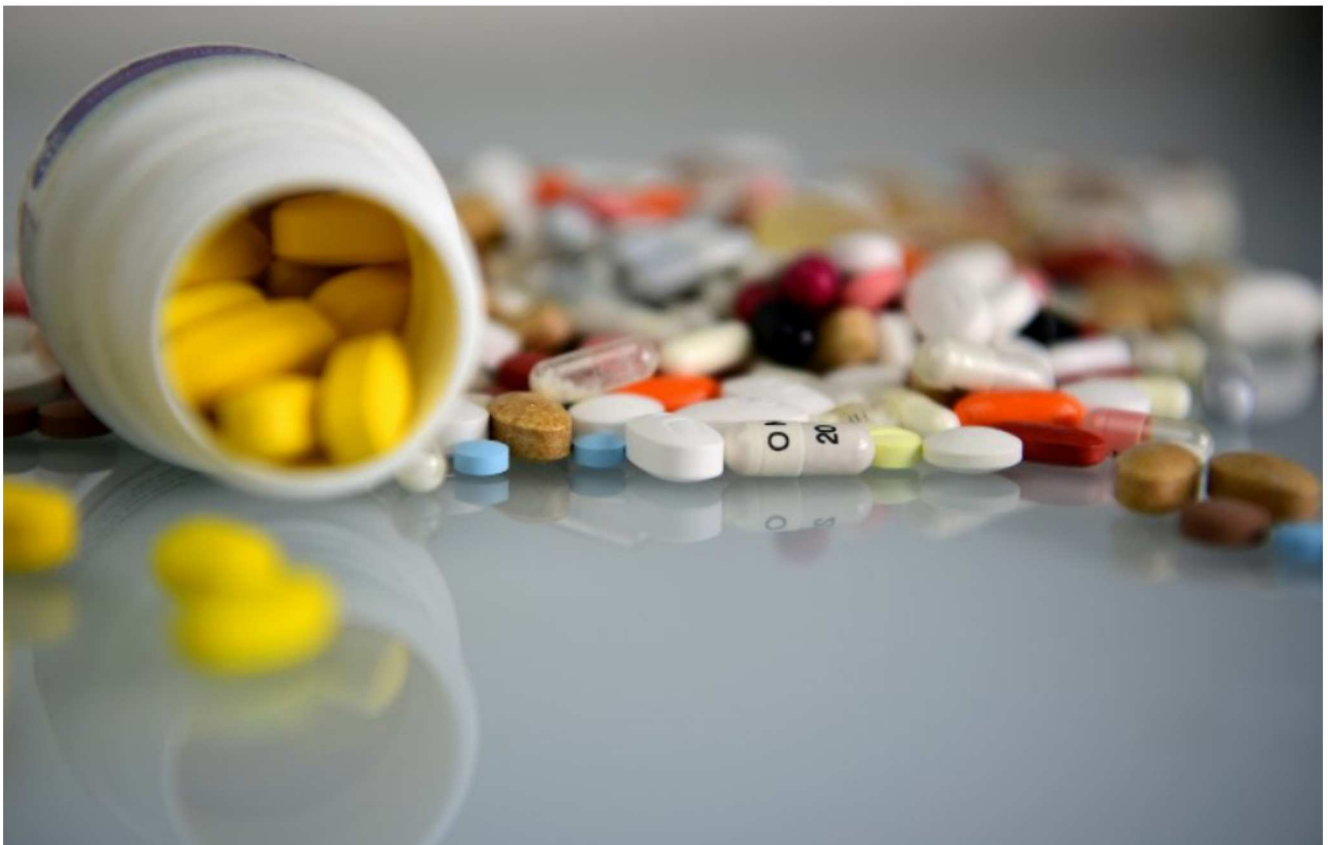
Des médicaments issus de l'industrie pharmaceutique britannique (image d'illustration).

Oihana Gabriel | Publié le 27/09/18 à 12h44 — Mis à jour le 01/10/18 à 17h24